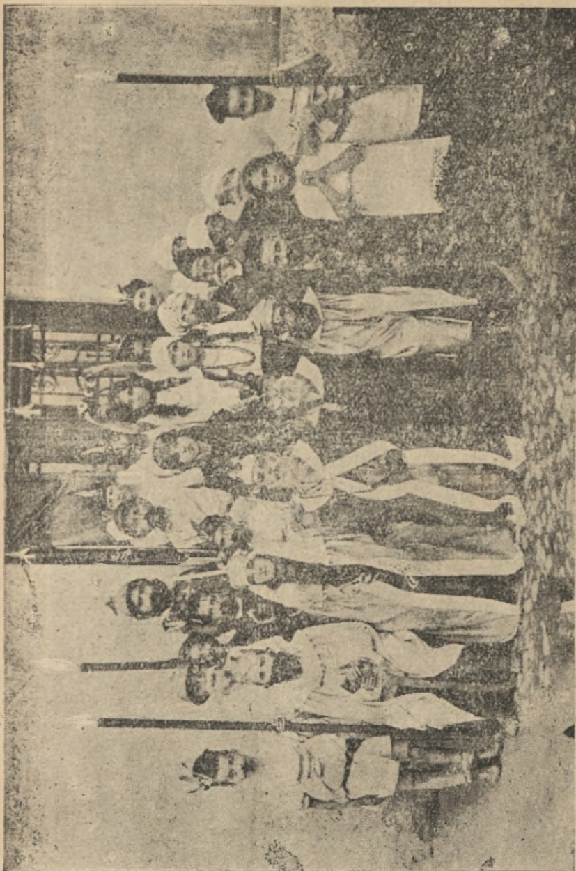
МАСКИРАНИ ИГРАЧИ «КОСОВСКОГ БОЈА» ЂАЦИ ОСНОВНЕ ШКОЛЕ У ЛЕСКОВЦУ НА ВИДОВ-ДАН 1924. ГОД.